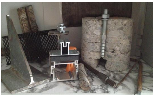
Expertise et utilisation de tous types de matériaux et d'éléments